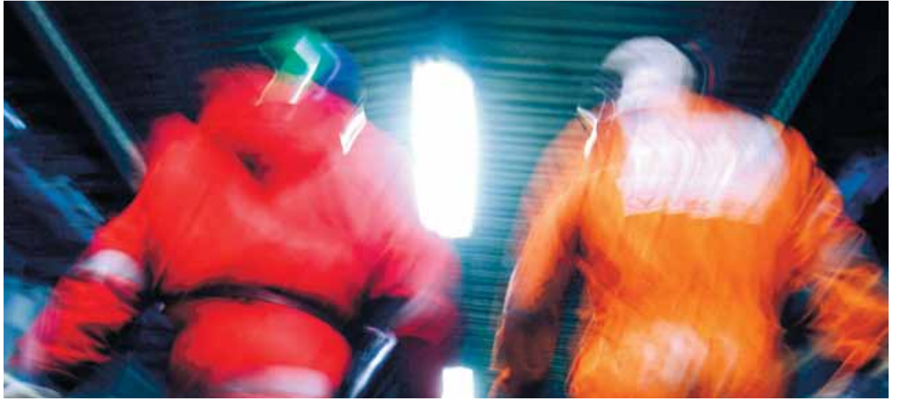
Brutalisering: Norsk arbeidsliv blir stadig tøffere.