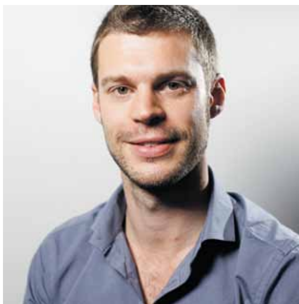
Nestleder i Rødt: Bjørnar Moxnes.

– Euroen er et reindyrka høyreprosjekt. I stedet for å føre motkonjunkturpolitikk for å komme over krisa, slik de fleste av verdens land gjorde i 2009, tvinges de svake landene nå i stikk motsatt retning, med store sosiale konsekvenser. Den samme politikken som IMF tvang en rekke u-land til å gjennomføre på 1980- og 1990-tallet blir nå påtvunget gjeldstyngede EU-land: Fast valutakurs, lave budsjettunderskudd, liberalisering, privatisering, lønnskutt, prioritering av gjeldsnedbetaling og åpning for internasjonal