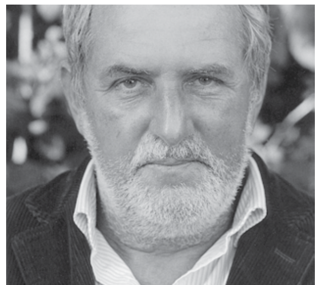
Skriver: Tidligere KK-redaktør Jon Michelet skriver om avisa i Rødt!