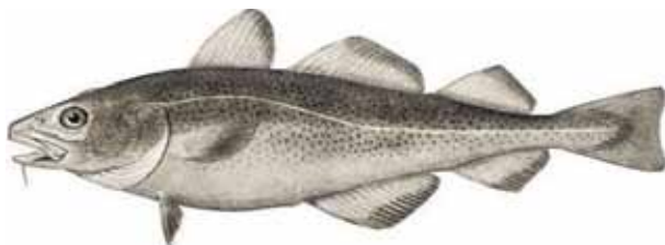
Torsken: En av våre viktigste naturressurser.