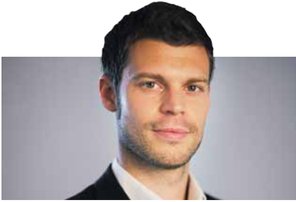
Bystyrerepresentant: Bjørnar Moxnes.